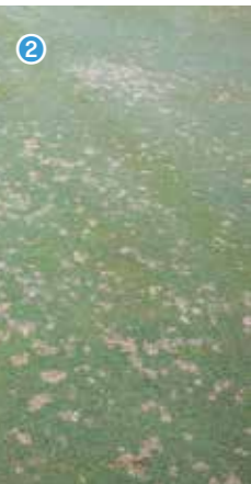
► BETERE LUCHTCIRCULATIE EN MINDER VAAK, MAAR LANGER BEREGENEN KAN SCHIMMELZIEKTES ALS FUSARIUM (FOTO 1) EN DOLLARSPOT (FOTO 2) HELPEN VOORKOMEN.